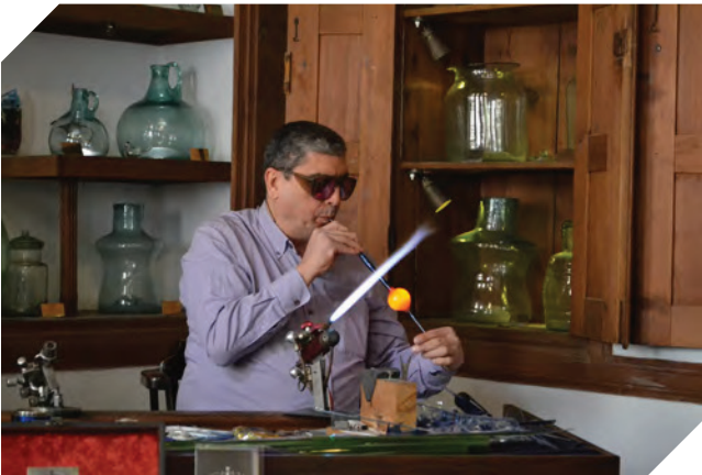
Görsel: Cam ustası, cam üfleme borusuyla camı şişirir ve şekillendirir.

Cam, sanat alanında da çok kullanılan malzemelerden biridir. Cam üretimindeki teknik gelişmeler, camın renklendirilmesini ve şekillendirilmesini kolaylaştırmış. Bu da camın sanat alanında kullanımının artmasını sağlamıştır. Günümüzde cam üretiminde kullanılan tekniklerin temeli İskenderiye ve Roma'da atılmış. Camın kalıplanması ve şekillendirilmesi, oyma ve renklendirilme işlemleri ta o zamanlarda biliniyor.